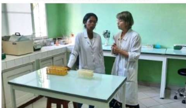
MADAGASCAR : Centre de santé d'Avaradoha