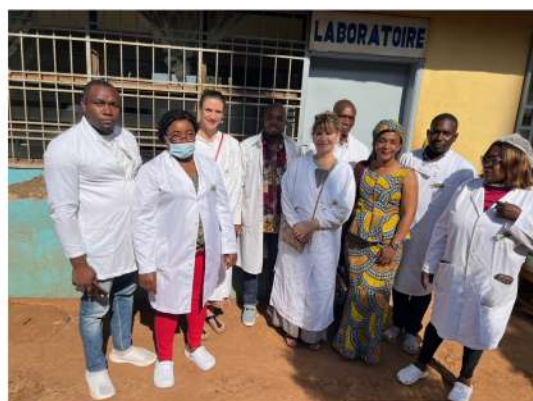
CAMEROUN : l'équipe devant le laboratoire

Le but est aussi la recherche de partenariats susceptibles de participer à la prise en charge nos interventions.