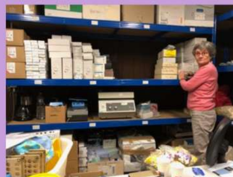
Local matériel de l'antenne Île-de-France

Adressez vos propositions à assistante@bsf.asso.fr