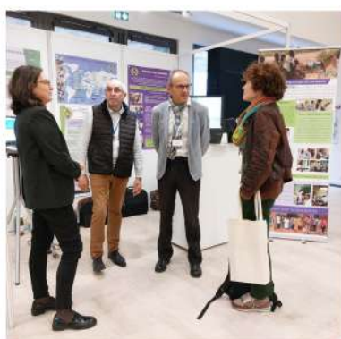
TROYES : Congrès des JFBM

N'hésitez pas à consulter, le site : biologiesansfrontieres.org , facebook et LinkedIn (voir QR code en bas de page 1)